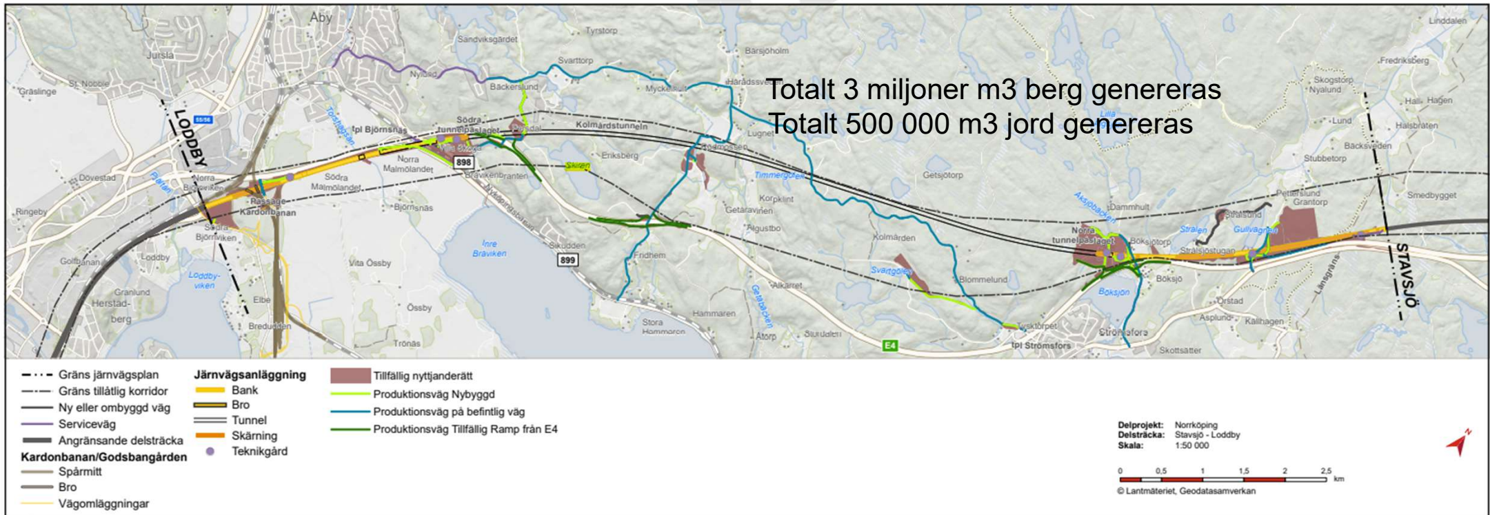
Figur 12. Översikt över byggvägar och arbetsområden i byggskedet.