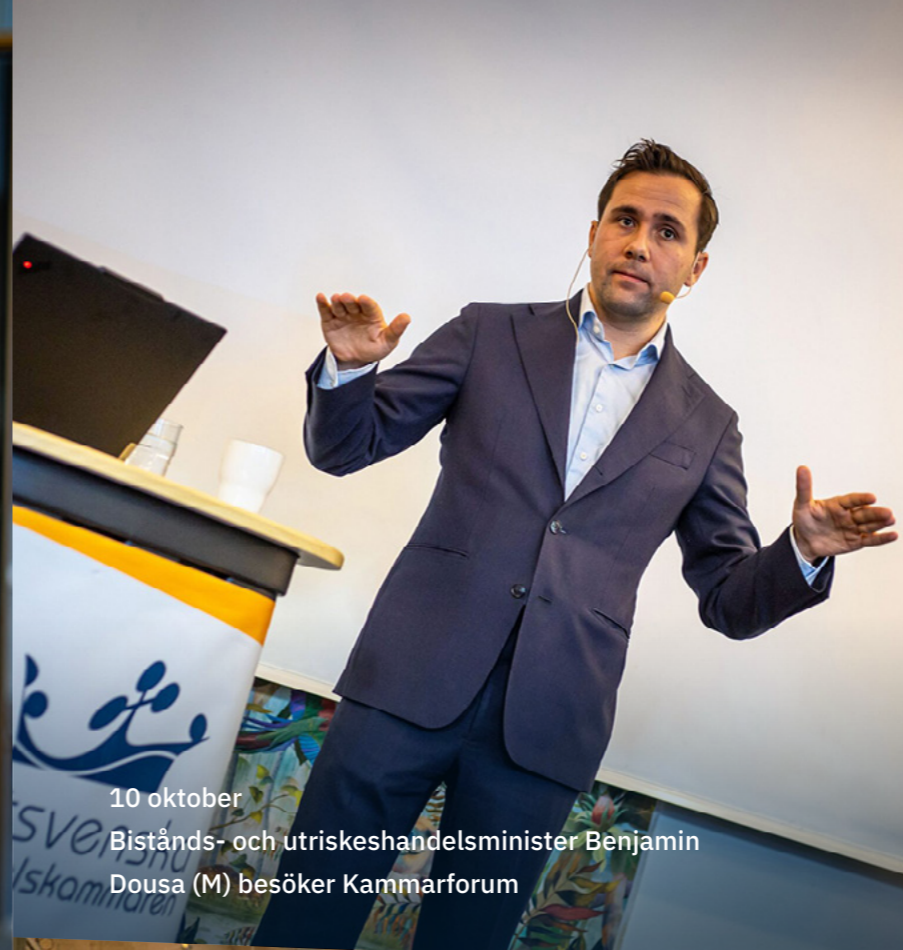
10 oktober Bistånds- och utrikeshandelsminister Benjamin Dousa (M) besöker Kammarforum