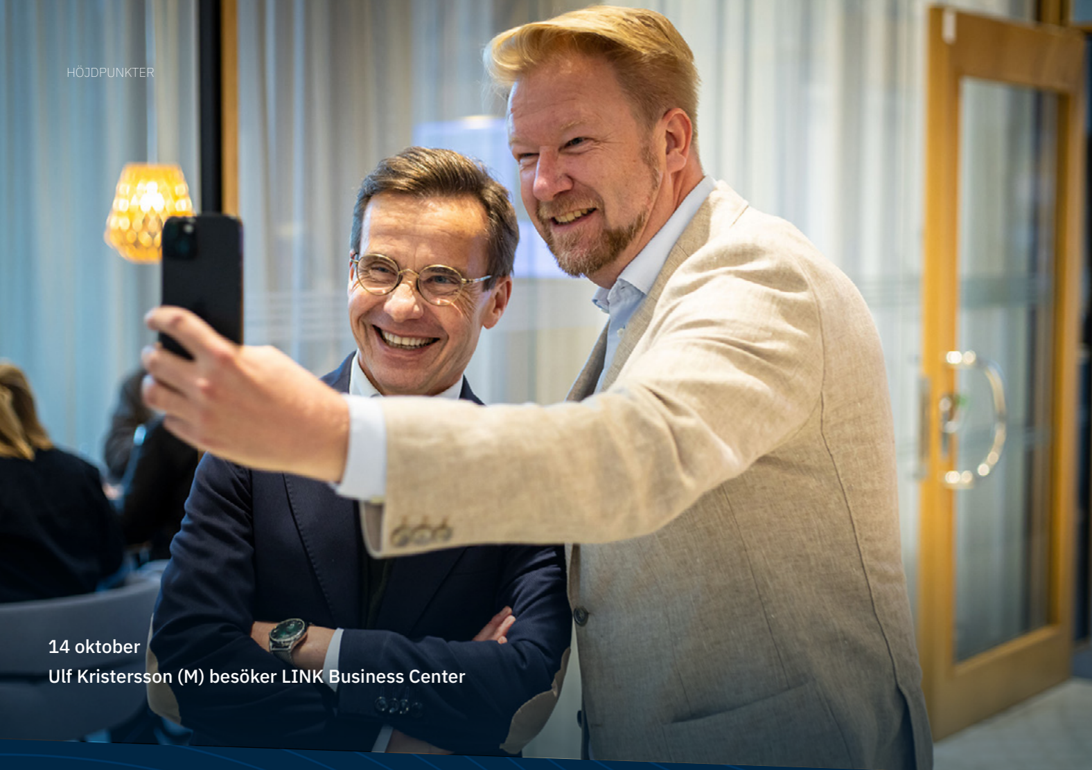
14 oktober Ulf Kristersson (M) besöker LINK Business Center