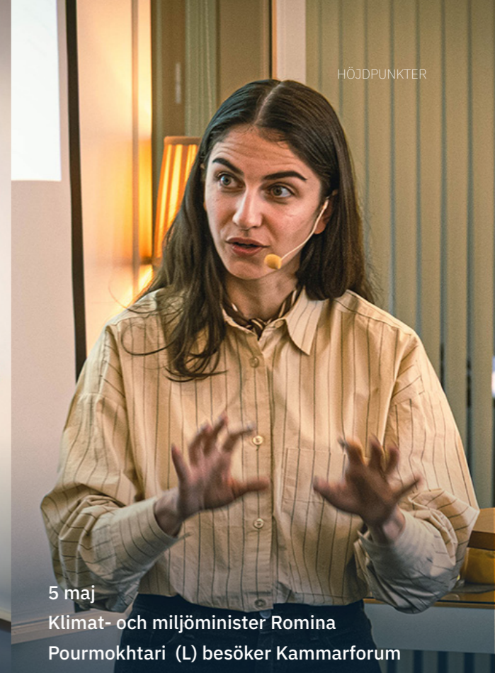
5 maj Klimat- och miljöminister Romina Pourmokhtari (L) besöker Kammarforum